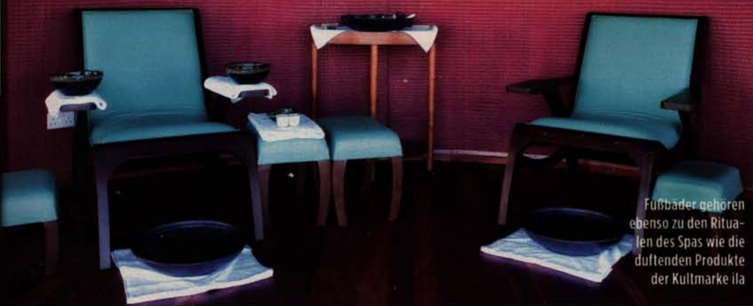
Fußbäder gehören ebenso zu den Ritualen des Spas wie die duftenden Produkte der Kultmarke ila